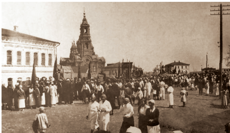
Разрушенный Троицкий храм Балаково, в котором служил праведный Александр Чагринский