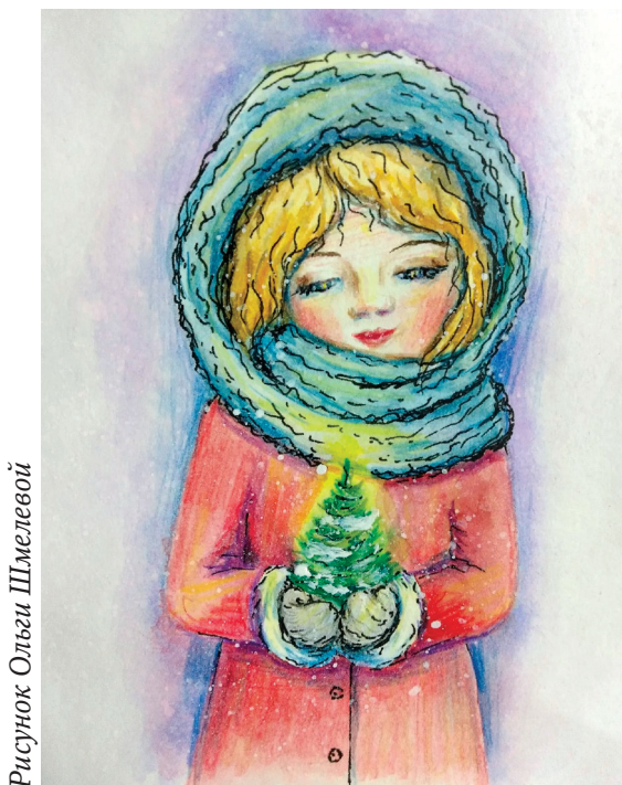
Рисунок Ольги Шмелевой

Из высот небесных Раздалось вдруг пенье: «Слава, слава в вышних Богу, на земле благоволень!»