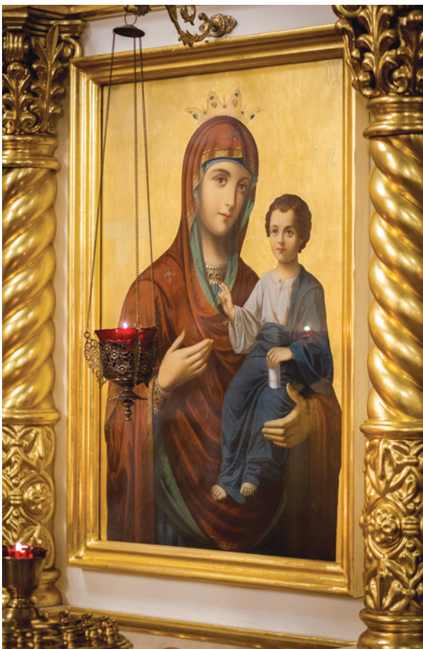
Иверская икона Божией Матери. Написана на Афоне в конце XIX — начале XX века. Свято-Троицкий кафедральный собор г. Покровска (Энгельса)

Со временем в Москве появился еще одна копия иконы, заказанная на Афоне. Ее установили у Воскресенских ворот Китай-города, через которые совершались