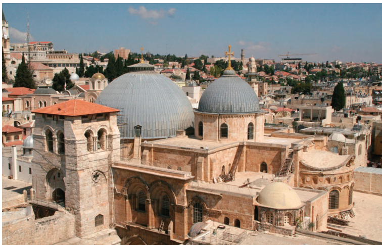
Храм Воскресения Христова

Место, где был погребен и воскрес Христос, с самого начала христианской Церкви стало предметом почитания. С тех пор прошли века. Власть в Иерусалиме переходила из рук в руки, храм Воскресения Христова разрушали и отстраивали заново, но поток паломников со всего мира, желающих почтить это святое место, не иссякает по сей день.